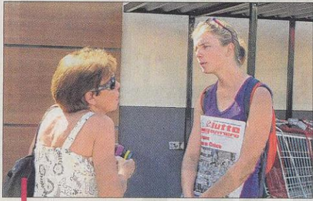
Tout l'été, les militants de Lutte Ouvrière sont allés à la rencontre des travailleurs, chômeurs, jeunes, retraités...