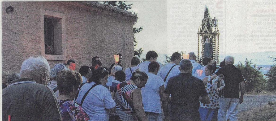
Les fidèles étaient une cinquantaine au sommet du Rocher, mais de nombreux autres les ont rejoints en bas, pour la procession à travers le Village

Hier soir, de nombreux croyants étaient présents pour assister à la descente de la Vierge